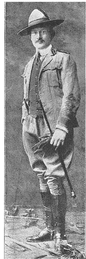
General R. S. S. Baden-Powell.

Ansvarsfulla poster i kolonierna höll general Baden-Powell under flera år, efter det boerkriget bragts till ett för England lyckligt slut, hemifrån. Men han hade ej glömt de lärdomar, den långa belägringen gett honom. Och då han för ett