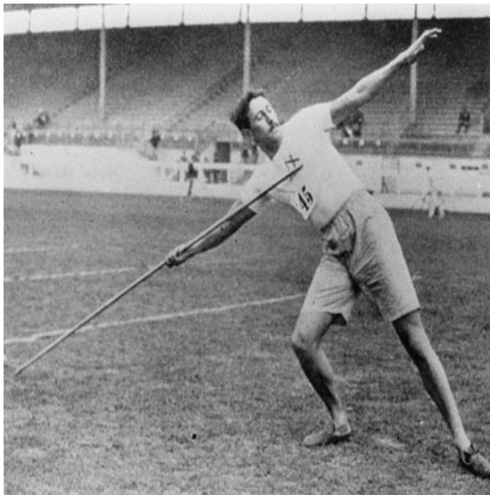
"London, July 1908. Games of the IV Olympiad. Men's athletics, javelin: Sweden's Eric LEMMING, future winner of the event, in action."