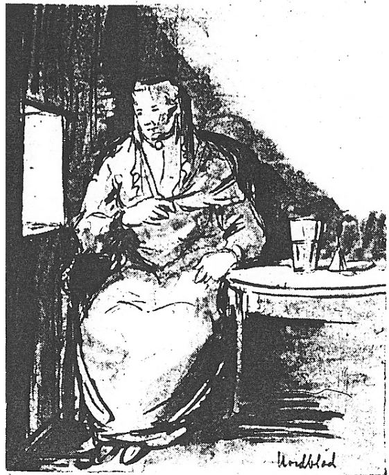
Där satt hon om dagarna.

Hur Mrs Johnson ådrog sig den lunginflammation som ändade hennes liv är mig en gåta. Hon hade inte varit utomhus på flera år. Johnson gjorde alla uppköp och höll uppsikt och räfst med alla tjänarna, från kokerskan ned till köksan. Men så hade han också ända till för tjugo år sedan varit hovmästare hos en earl,